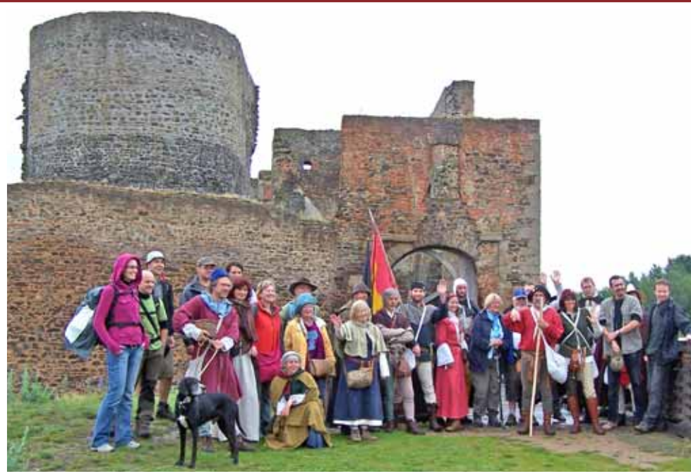
Etappe 2 Bärnau-Lauf